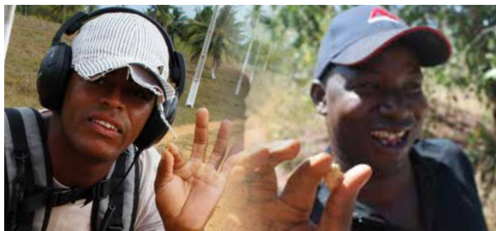
ဤ လက်ကမ်းစားစောင်တွင် အသုံးပြုသည့် ရုပ်ပုံနှင့် ပုံနှိပ်ခြင်းများ သည် ရုပ်ပုံထည့်သွင်းဖော်ပြခြင်းသက်သက်သာဖြစ်ပါသည်။ အသေးစိတ်သိရှိလိုပါက ဤပစ္စည်းနှင့် သက်ဆိုင်သည့် လက်စွဲ စာအုပ်တွင် လေ့လာနိုင်ပါသည်။ Minelab, SDC 2300 နှင့် MPF တို့ သည် Minelab Electronic Pty. Ltd. ၏ တုန်ပစ္စည်း အမှတ် တံဆိပ်များဖြစ်ပြီး မူပိုင်ခွင့် မှတ်ပုံတင်ပြီး ဖြစ်သည်။